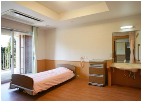
プライバシーを重視した自由な生活空間です。 ※家具等の持込み可能です。