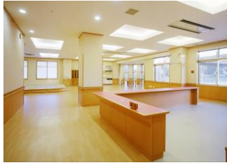
デイサービスセンター受付