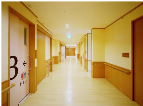
ユニット内に3つの身障者用トイレを完備しています。