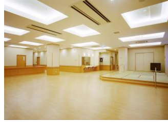
食堂・機能訓練室