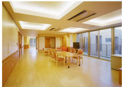
キッチンやテレビ等を完備する共有スペースです。入居者との憩いの場です。